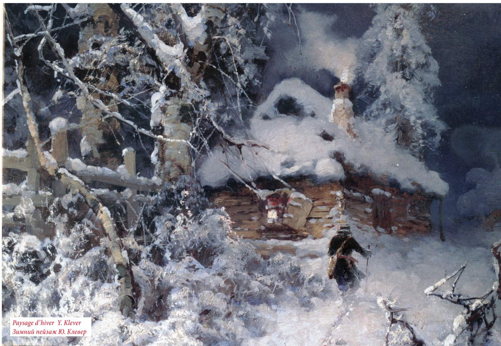
Paysage d'hiver Y. Klever Зимний пейзаж Ю. Клевер