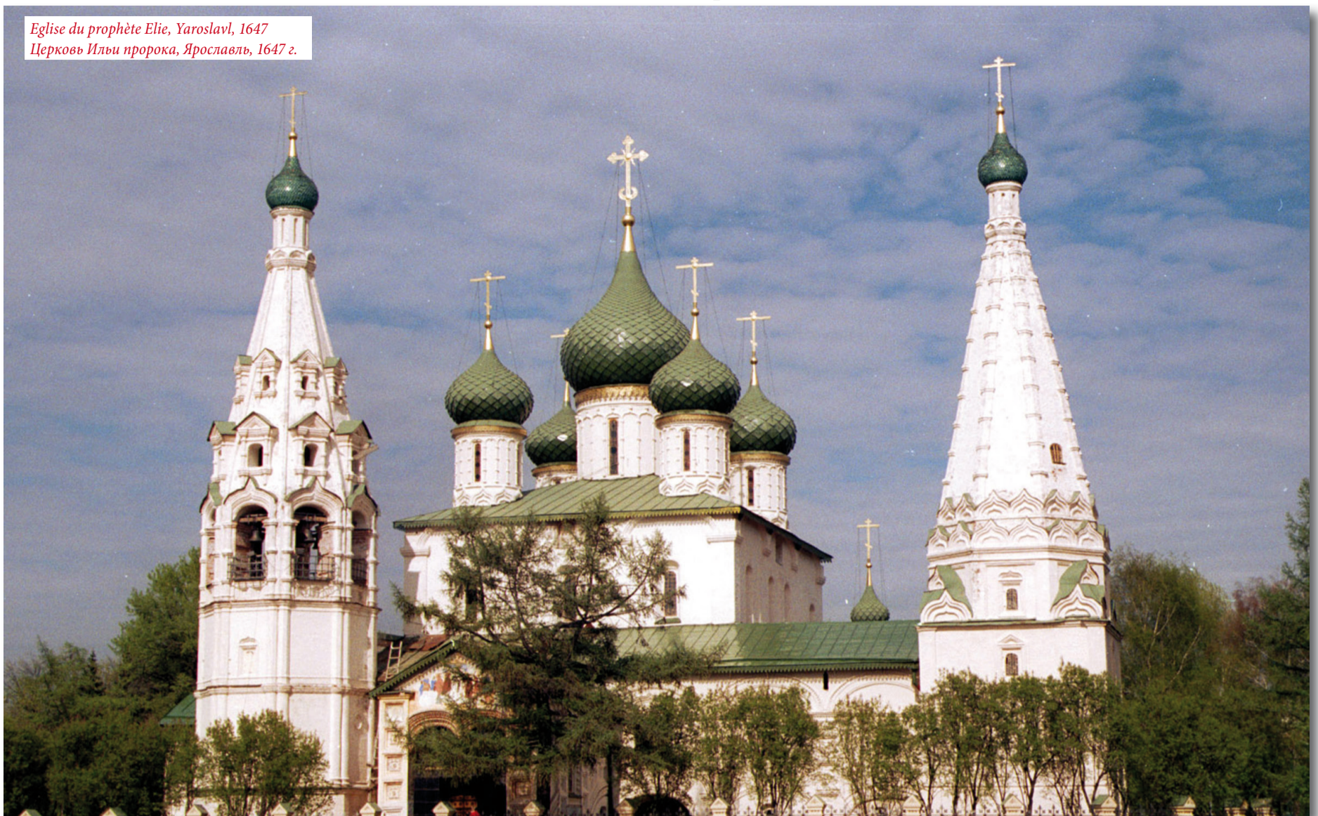
Eglise du prophète Elie, Yaroslavl, 1647 Церковь Ильи пророка, Ярославль, 1647 г.

7 25.12 ДВУНАДЕСЯТЫЙ ПРАЗДНИК FÊTE LITURGIQUE MAJEURE 8 26.12 ВЕЛИКИЙ ПРАЗДНИК GRANDE FÊTE LITURGIQUE 9 27.12 Церковный Праздник святой Fête Liturgique saint 10 28.12 Воскресные и французские нерабочие дни Dimanches et fêtes françaises chômées Строгий пост Jeûne et abstinence sévères Поста нет Sans abstinence ni jeûne Поста Jeûne et abstinence См. комментарий ко дню Cf. note concernant ce jour