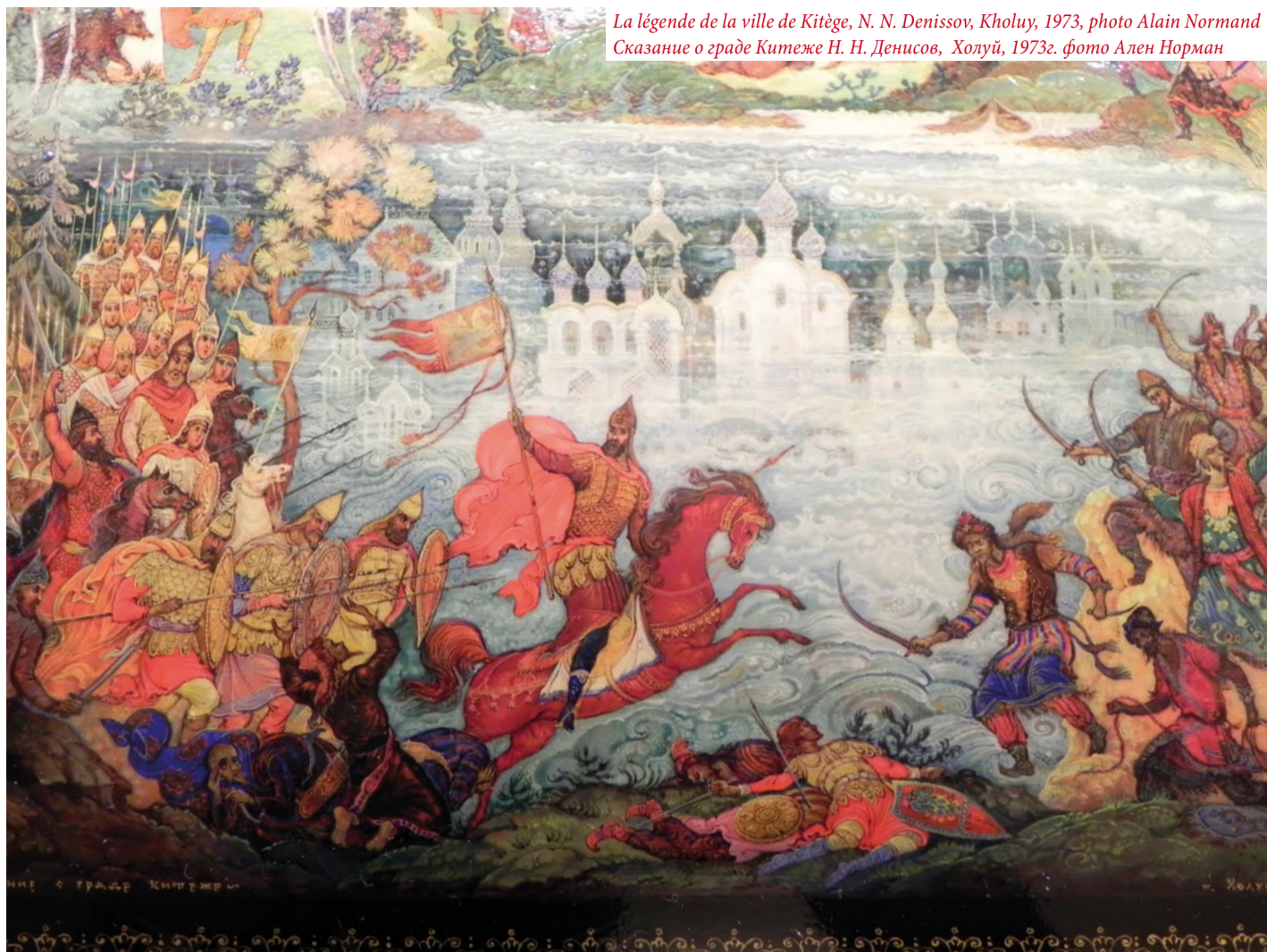
La légende de la ville de Kitège, N. N. Denisov, Kholuy, 1973, photo Alain Normand Сказание о граде Китеже Н. Н. Денисов, Холуй, 1973г. фото Ален Норман