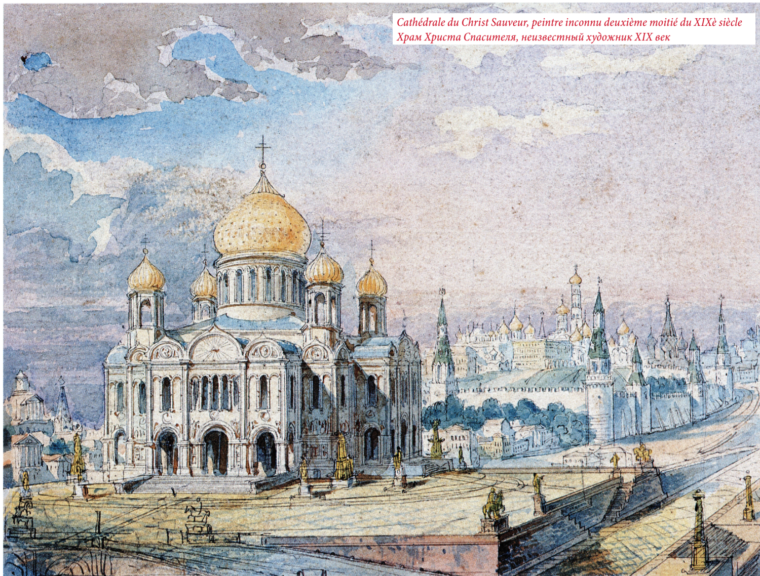
Cathédrale du Christ Sauveur, peintre inconnu deuxième moitié du XIX e siècle Храм Христа Спасителя, неизвестный художник XIX век