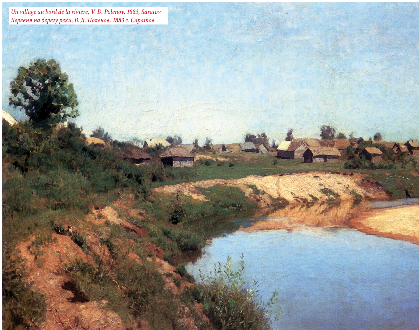
Un village au bord de la rivière, V. D. Polenov, 1883, Saratov Деревня на берегу реки, В. Д. Поленов, 1883 г. Саратов