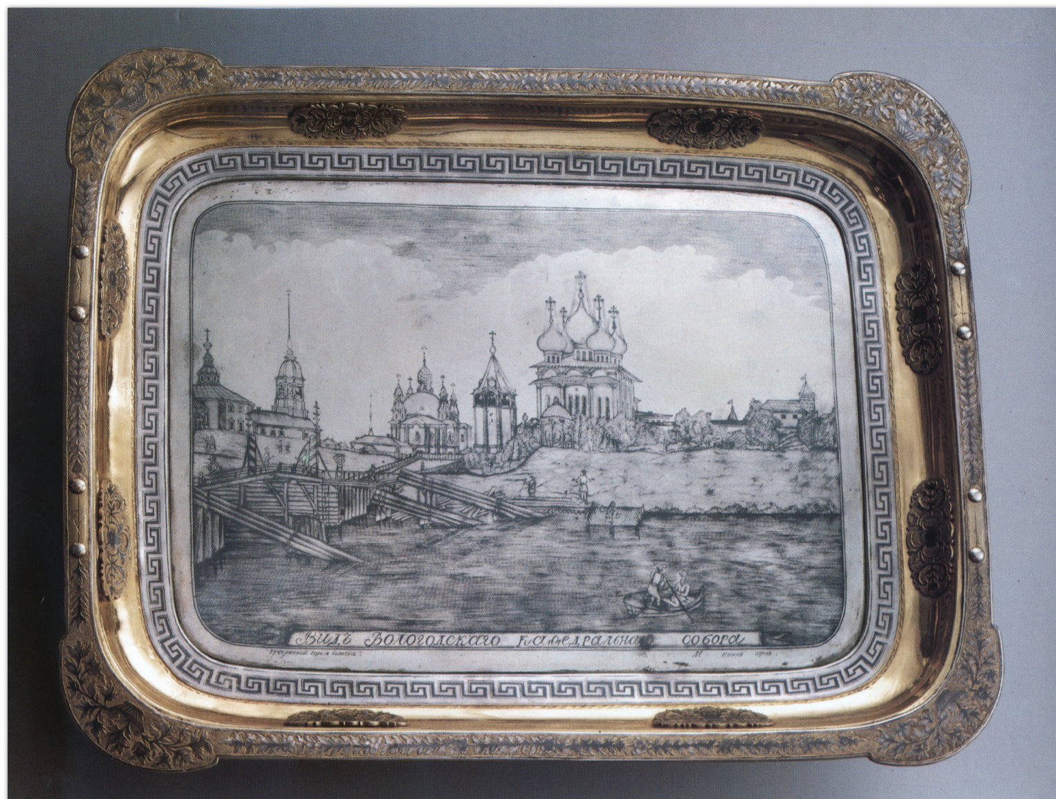
Plateau en argent niellé représentant la cathédrale de Vologda, Maître Ivan Zouïev, Vologda, 1837 Поднос из чёрного серебра с изображением Вологодского кафедрального собора, Мастер Иван Зуев, Вологда, 1837г.