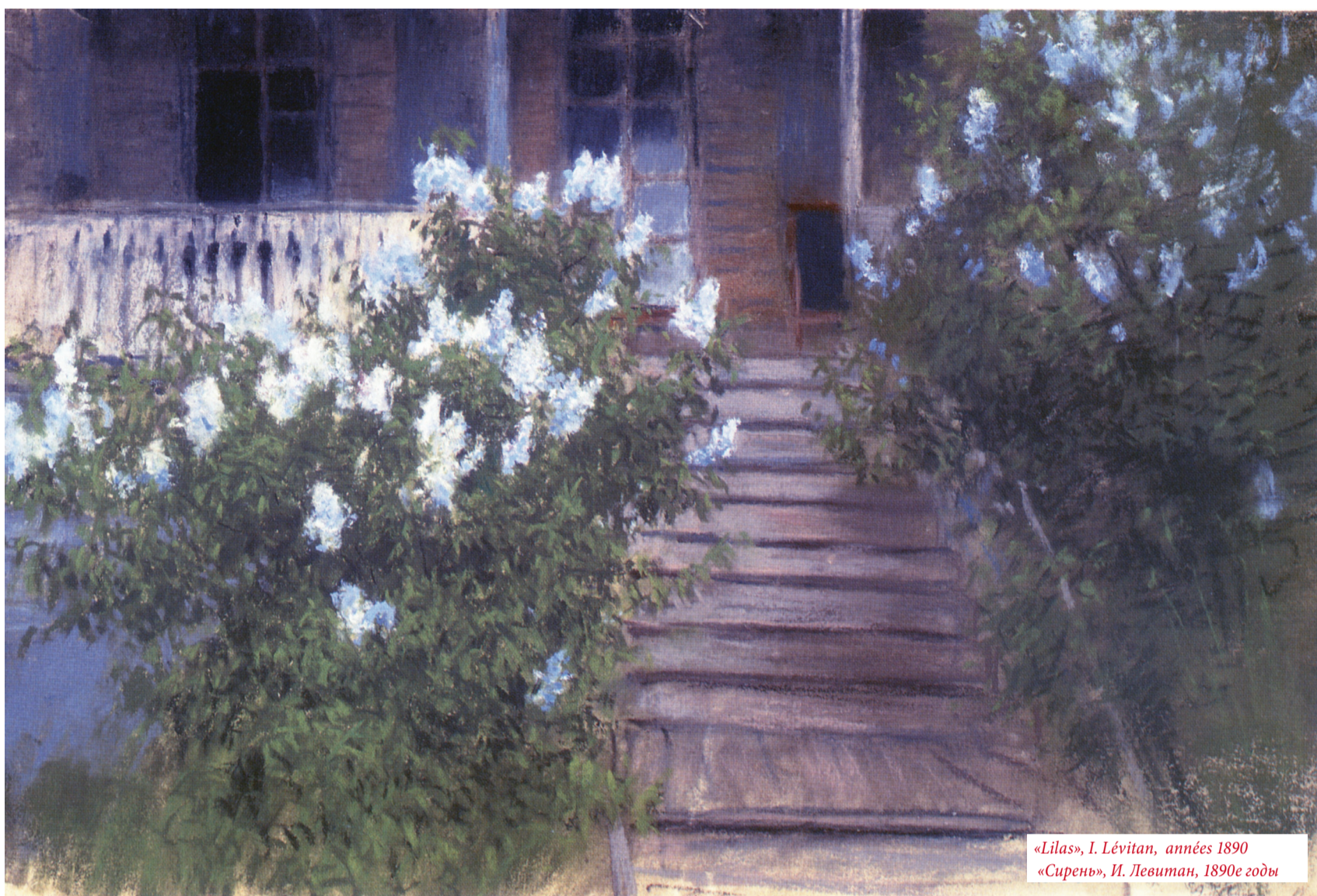
«Lilas», I. Lévitane, années 1890 «Сирень», И. Левитан, 1890е годы