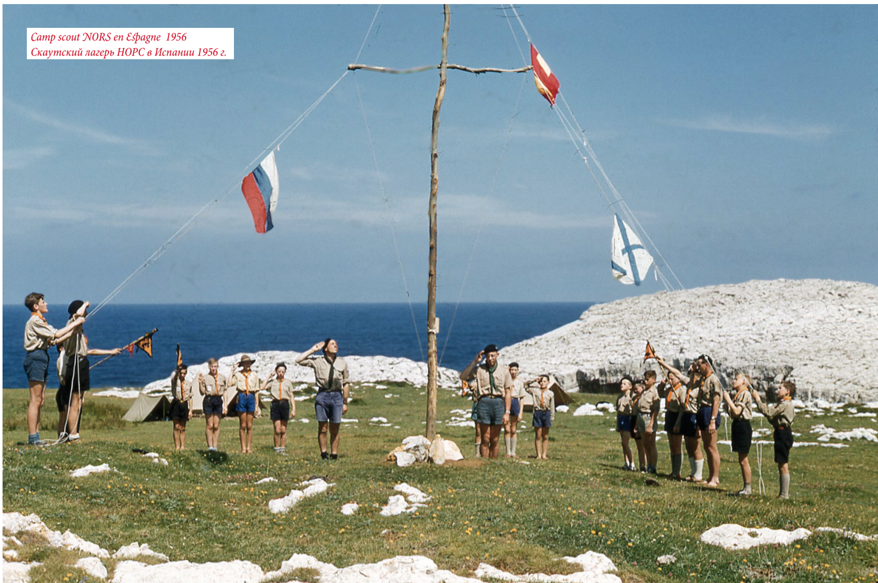
Camp scout NORS en Espagne 1956 Скаутский лагерь НОРС в Испании 1956 г.