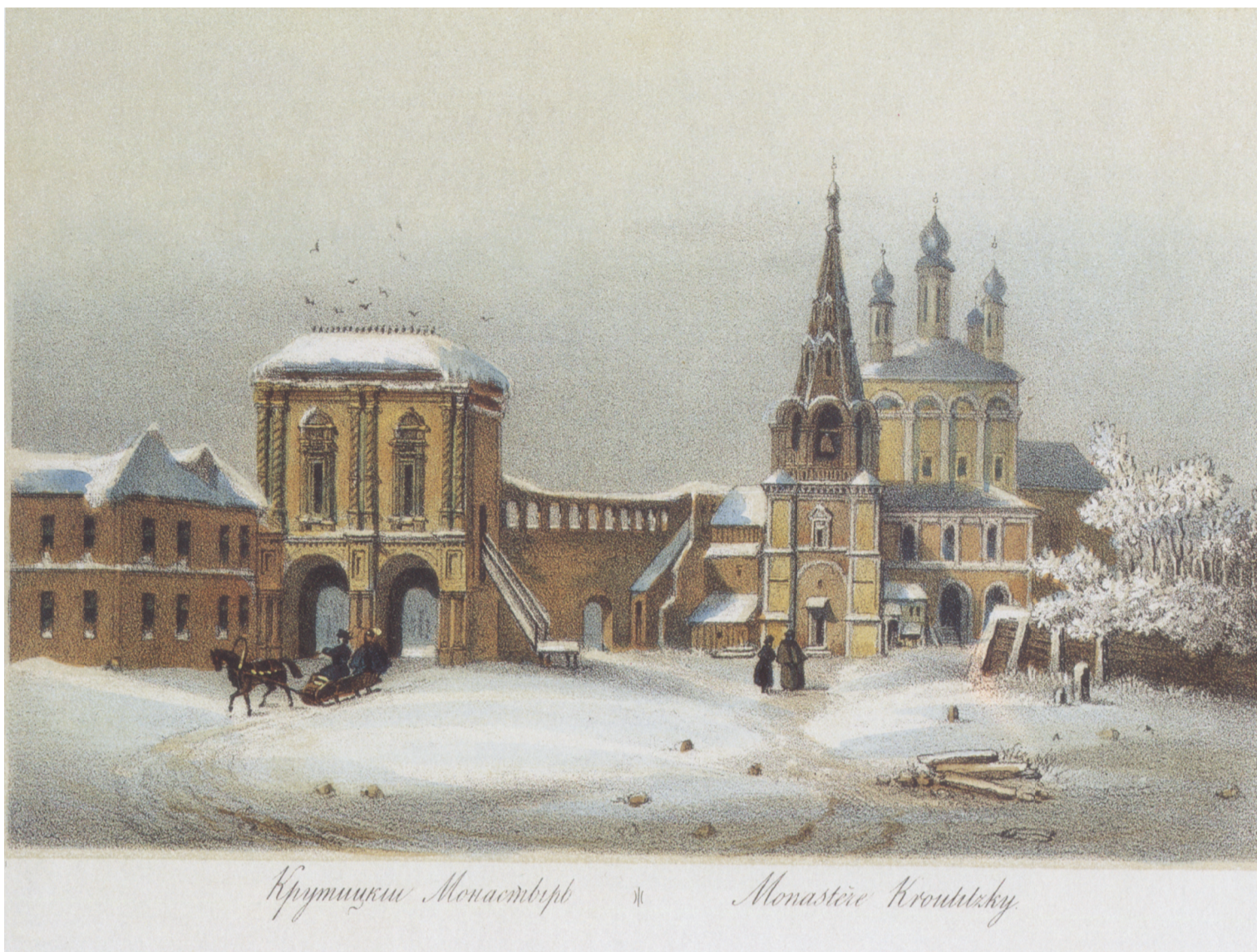
Крутицкий Монастырь * Monastère Kroutskiy