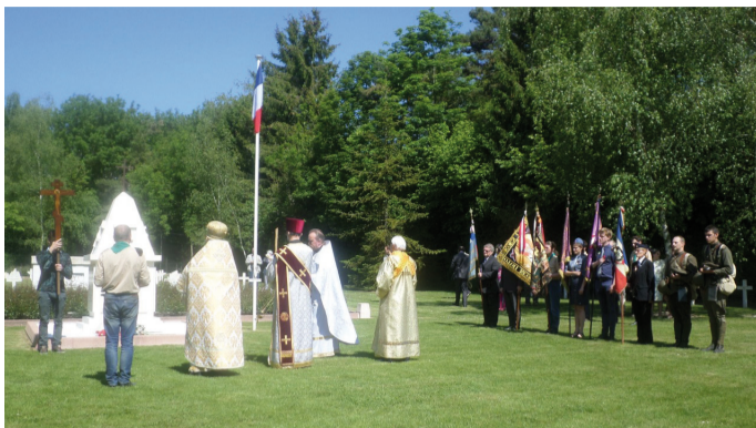
Паломничество на русское военное кладбище в Сент-Илер-лэ-Гран - 2015 г.

Каждый год во Франции, на католический праздник Троицы, совершается паломничество на русское военное кладбище с православной часовней в местечке Сент-Илер-лэ-Гран, близ г. Мурмелон. Оно организовано Союзом памяти Русского Экспедиционного корпуса на Западном фронте (1916-1918), в нём принимают участие не только французские военные и гражданские власти, но и все те, кто помнит и чтит память солдат Русского Экспедиционного корпуса, павших в рядах французской армии во Франции и в Македонии во время Первой Мировой войны.