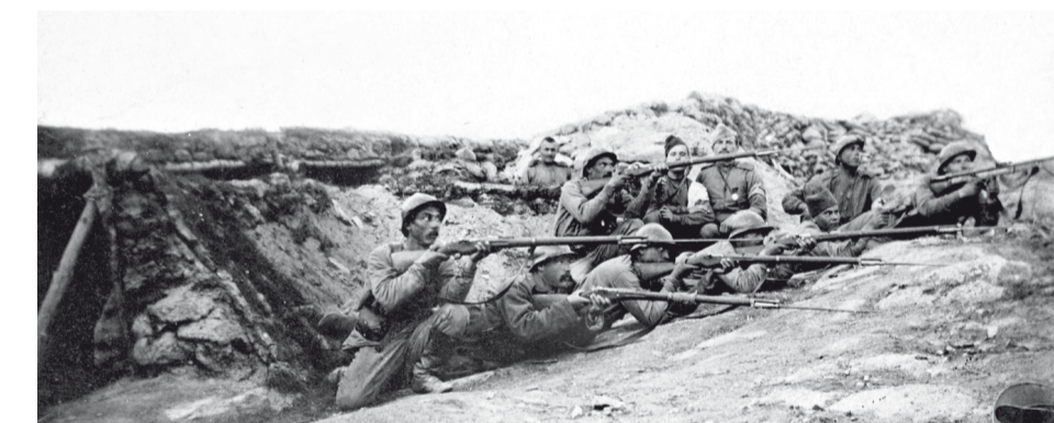
Салоникский фронт, позируя фотографу, солдаты делают вид, что отбивают атаку противника.

En 1917, la révolution russe et le coup d'état d'octobre provoquent un relâchement de la discipline parmi les soldats ; les brigades sont dissoutes. Les négociations de Brest-Litovsk entre le gouvernement bolchévique et l'Allemagne aboutissent le 3 mars 1918 à une paix séparée entre l'Allemagne et la Russie.