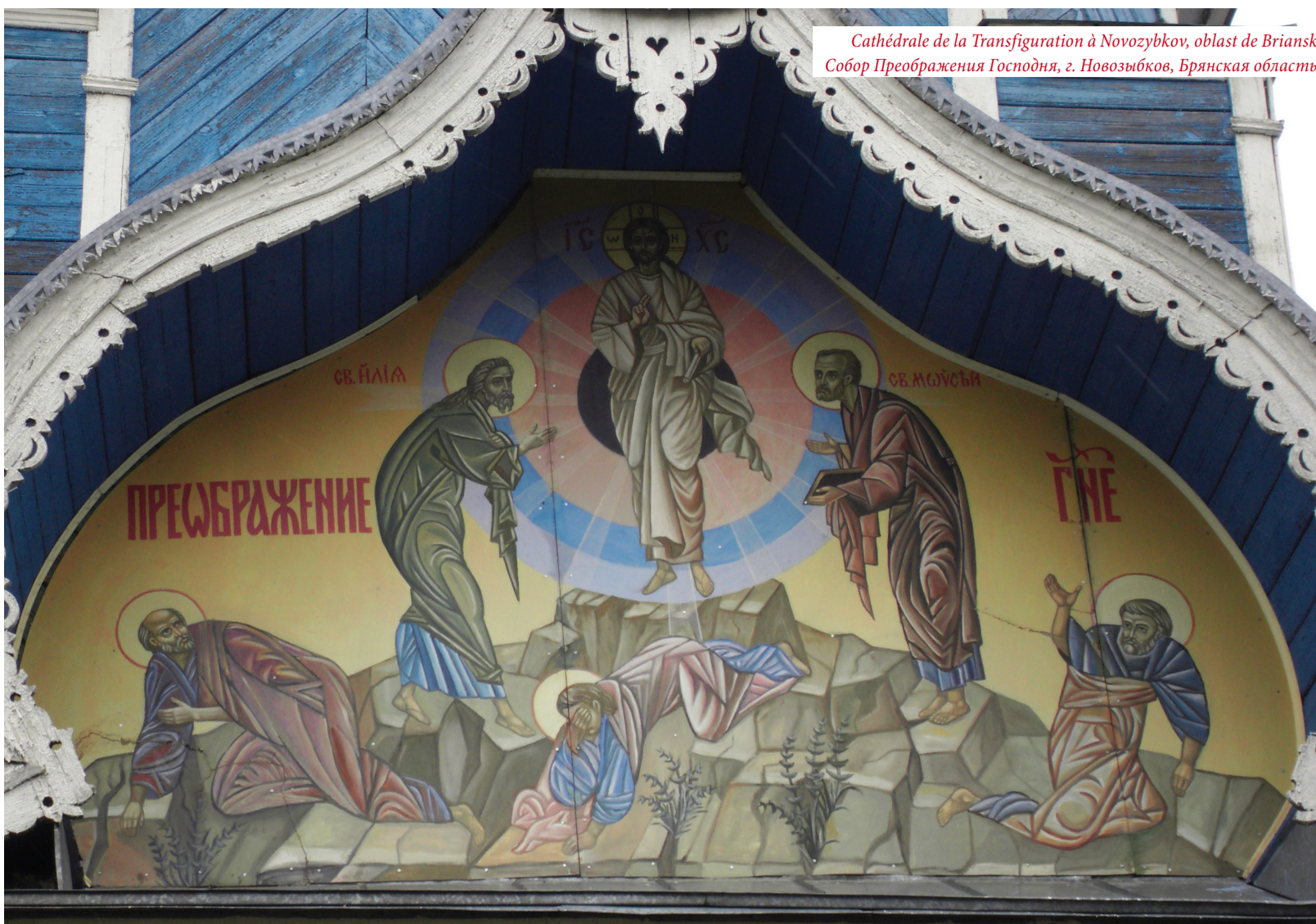
Cathédrale de la Transfiguration à Novozybkov, oblast de Briansk Собор Преображения Господня, г. Новозыбков, Брянская область