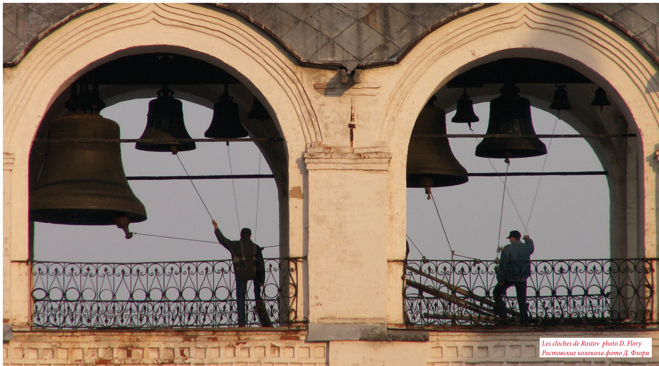
Les cloches de Rostov Ростовские колокола

7 25.12 ДВУНАДЕСЯТЫЙ ПРАЗДНИК FÊTE LITURGIQUE MAJEURE 8 26.12 ВЕЛИКИЙ ПРАЗДНИК GRANDE FÊTE LITURGIQUE Строгий пост Jeûne et abstinence sévères Поста нет Sans abstinence ni jeûne Пост Jeûne et abstinence См. комментариев ко дню Cf. note concernant ce jour 9 27.12 Церковный Праздник святой Fête Liturgique 10 28.12 Воскресные и французские нерабочие дни Dimanches et fêtes françaises chômées