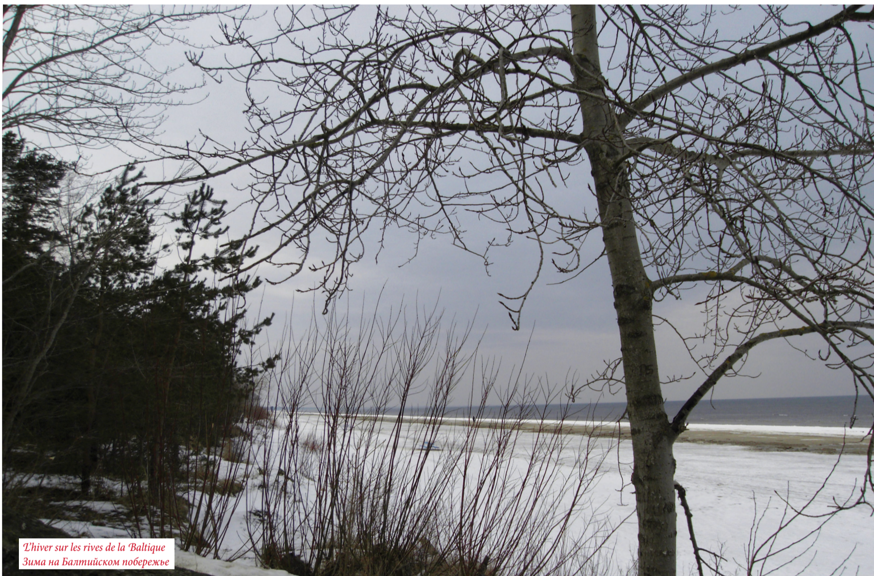
L'hiver sur les rives de la Baltique Зима на Балтийском побережье