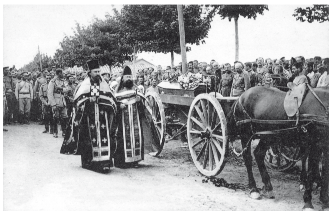
Похоронная процессия, хоронят убитых в бою, здесь в лагере Майи.

За время Великой войны Россия потеряла шесть миллионов человек убитыми, ранеными и пропавшими без вести за общее дело. Потери России убитыми и пропавшими без вести составляют 46,4 % потерь всех союзных стран.