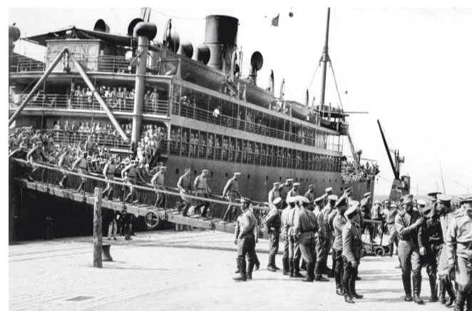
Брест, 17 июля 1916 г. Солдаты высаживаются с транспорта « Венесуэла », который их доставил из Архангельска.

À la demande des Alliés, la Russie envoie en 1916 en France 45 000 hommes répartis en quatre brigades : deux partent combattre sur le front en France et deux autres à Salonique sur le front d'Orient. La 1ère brigade russe, acheminée à travers la Sibirie et la Mandchourie vers Marseille, est composée de deux régiments et comprend tant des bataillons de réserve, que des sous-officiers et officiers qui ont déjà combattu sur le front de l'Est. Les trois autres brigades passent au nord par Arkhangelsk et vont combattre sur le front de Champagne en France et sur le front de Macédoine en Orient. A mi-novembre 1916, les quatre brigades sont à pied d'œuvre. A l'issue de terribles combats, les troupes russes reçoivent de multiples éloges, la croix de guerre récompense les drapeaux des régiments.