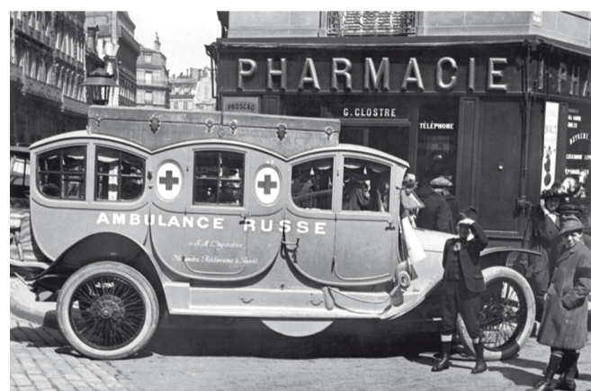
Один из автомобилей санитарного отряда, подаренного Францией императрицей Александрой Фёдоровной.

В 1891 г. Россия и Франция обязались оказывать взаимную помощь в случае агрессии со стороны третьей державы, этот союз был подтверждён императором Николаем II во время пребывания во Франции в 1896 г. и президентом Феликсом Фором в 1898 г. в ходе ответного визита в Россию. И так, с самого начала военных действий в августе 1914 г., Россия, даже ещё не закончив мобилизацию, начала наступление в Восточной Пруссии. Это вынудило немцев перебросить два армейских корпуса на восток накануне битвы на Марне, но привело к большим потерям среди русских войск. Вспомним слова маршала Фоша: «Если Франция не была стёрта с карты Европы, то этим мы обязаны прежде всего России...». По просьбе Союзников, Россия отправила во Францию