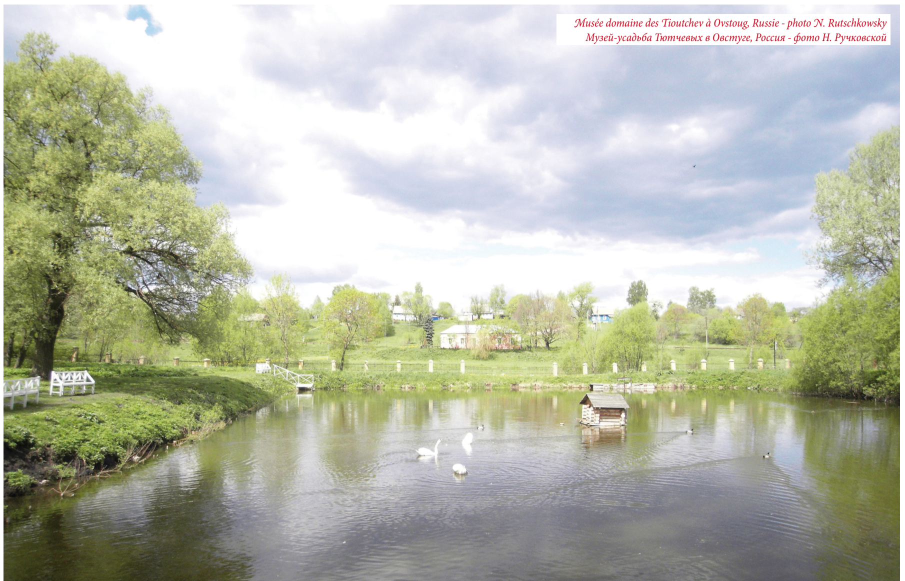
Musée domaine des Tioutchev à Ovtoug, Russie Музей-усадьба Тютчевых в Овстуге, Россия