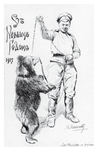
Мишка под кличкой «Земляк», талисман Русского Экспедиционного корпуса. Открытки с рисунками А. Марселли к Новому 1917 году.

Bibliographie et photos : Le Corps Expéditionnaire russe en France et à Salonique, 1916-1918 G. Gorokhoff, A. Korliakov, УМСА-PRESS, 2003.