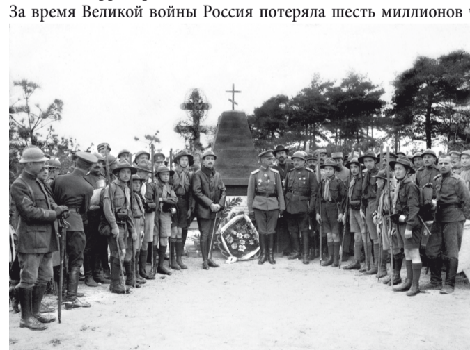
Сентябрь 1916. Торжественное открытие первого памятника павшим русским воинам близ Мурмелона, сентябрь 1916 г.

Ссылки и фотографии: Русский Экспедиционный корпус во Франции и в Салониках, 1916-1918. А. Корляков, Ж. Горохов, УМСА-PRESS, 2003