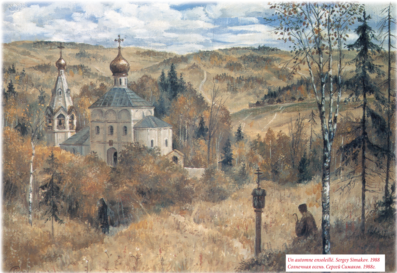
Un automne ensoleillé. Sergey Simakov. 1988 Солнечная осень. Сергей Симаков. 1988г.