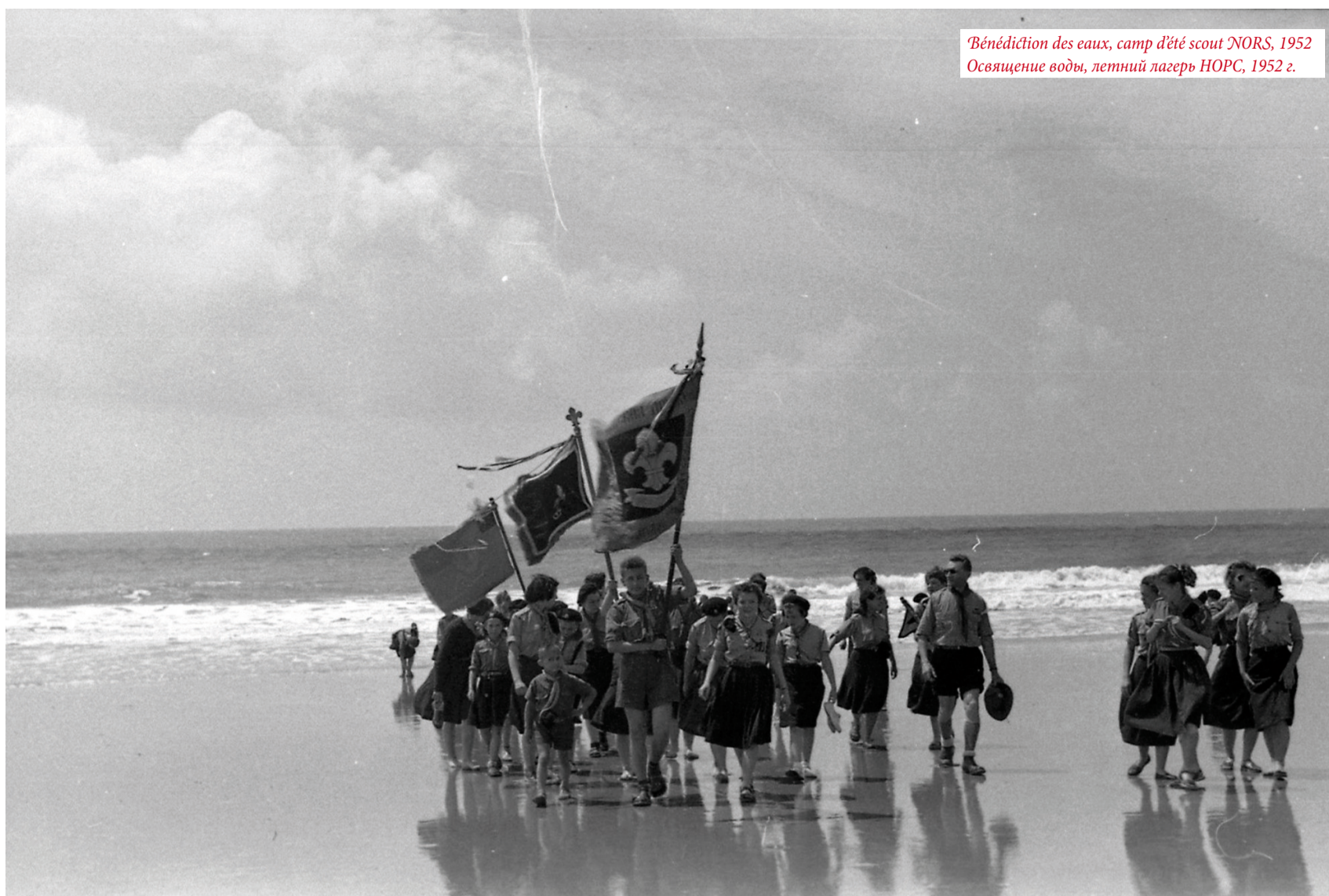
Bénédictio des eaux, camp d'été scout NORO, 1952 Освящение воды, летний лагерь НОРС, 1952 г.