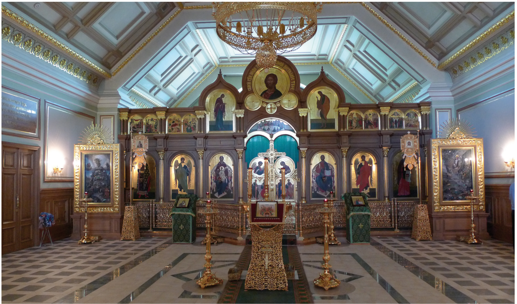
Eglise de St Macaire l'Egyptien de l'Institut des Mines. St Pétersbourg.

La première église des Cadets du Corps des Mines fut construite au XIX e siècle. Il y eut plusieurs reconstructions, conservant le style du classicisme russe, puis elle fut fermée en 1918. Rénovée, elle fut ouverte au culte en 2004.