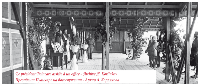
Le président Poincaré assiste à un office. Президент Пуанкаре на богослужении.

ments de férocité et de cruauté inhérents à la guerre. Pendant la première guerre mondiale 1914-1918 il y avait dans l'armée plus de 5 mille prêtres. Dans les circonscriptions militaires il y avait également des chapelains, des rabbins, des mollahs.