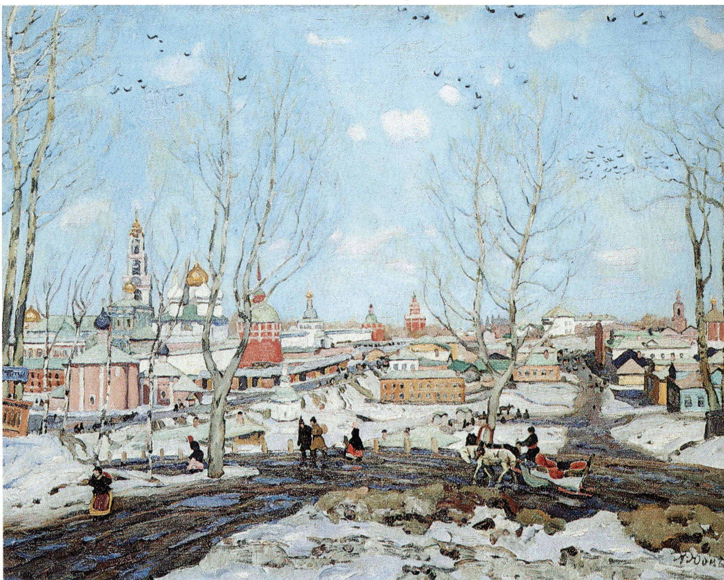
Le printemps, Laure de la Trinité St Serge. К. Ф. Юон. 1911 Весна. Троице-Сергиева Лавра. К. Ф. Юон. 1911 г.