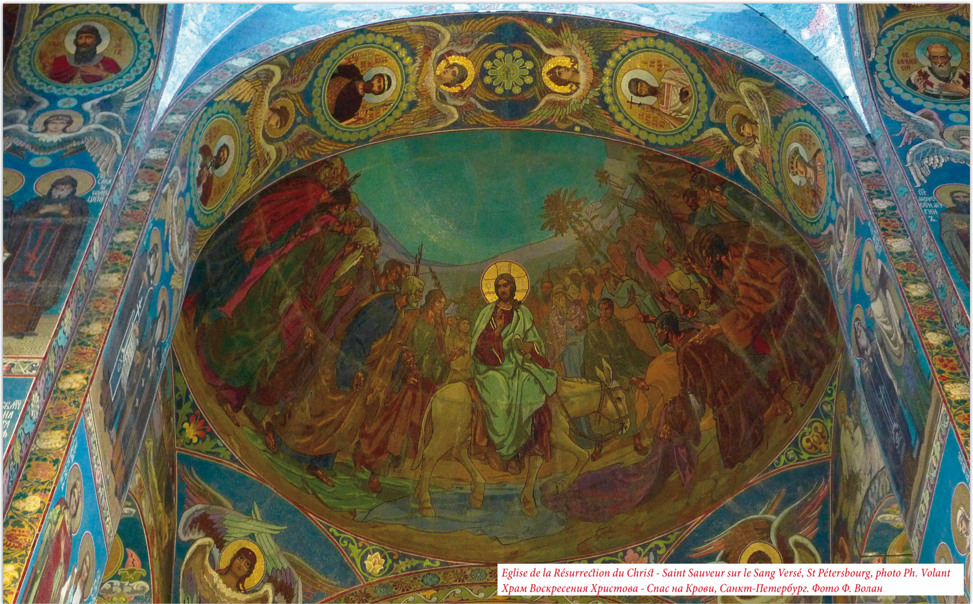
Eglise de la Résurrection du Christ - Saint Sauveur sur le Sang Versé, St Pétersbourg, photo Ph. Volant Храм Воскресения Христова - Спас на Крови, Санкт-Петербург. Фото Ф. Волан