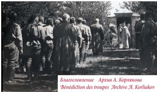
Благословение «Бенедикция des troupes»

В декабре 2013 года, на совещании Священного Синода Русской Православной Церкви принято Положение о военном духовенстве Русской Православной Церкви в Российской Федерации.