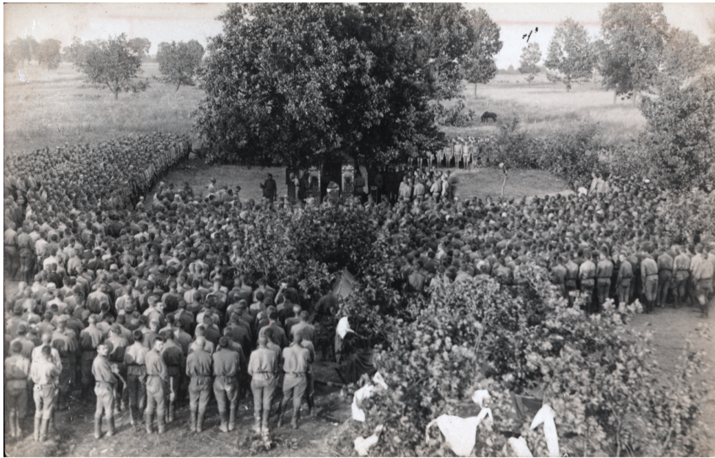
Office Богослужение

По закону протопресвитер военного и морского духовенства, как и епархиальные архиереи, назначался Святейшим Синодом, после чего утверждался в должности Императором. Протопресвитер стал единственным духовным лицом, свободно перемещавшимся по всей территории Российской империи. Последний протопресвитер Русской армии и флота, Георгий Иванович Шавельский, вспоминает свои бесчисленные поездки по фронтам, с посещением госпиталей, полков, батарей, окопов, нередко под огнем противника. Поездки сопровождалась раздачей иконок и крестиков. Безусловно, такие поездки и посещения частей поднимали дух воинов и укрепляли слабых, а также помогали контролировать работу строевых священников. Почти