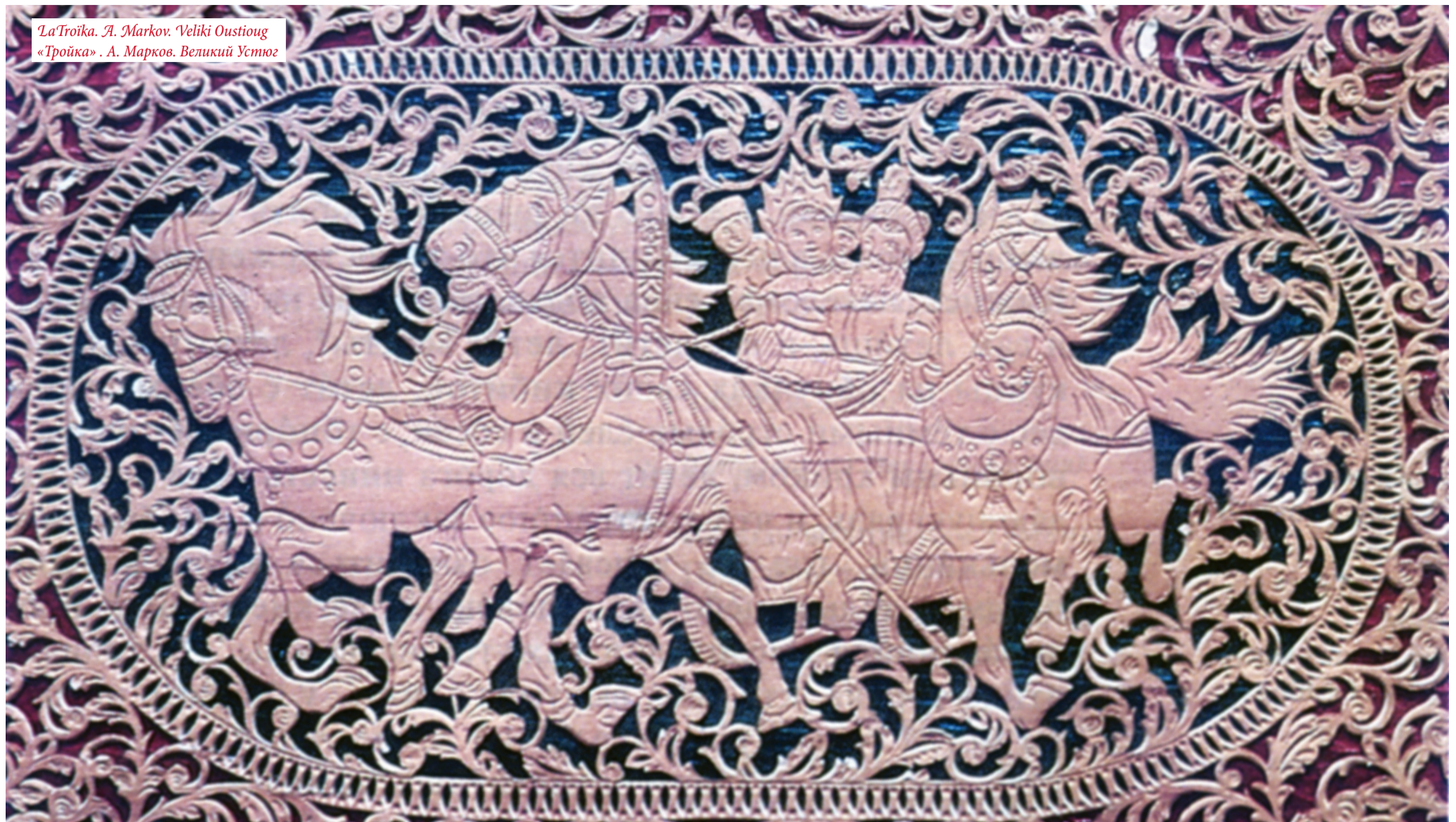
La Troïka. A. Markov. Veliki Oustioug «Тройка». А. Марков. Великий Устюг