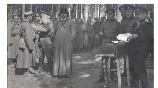
«Décoration» Награждение