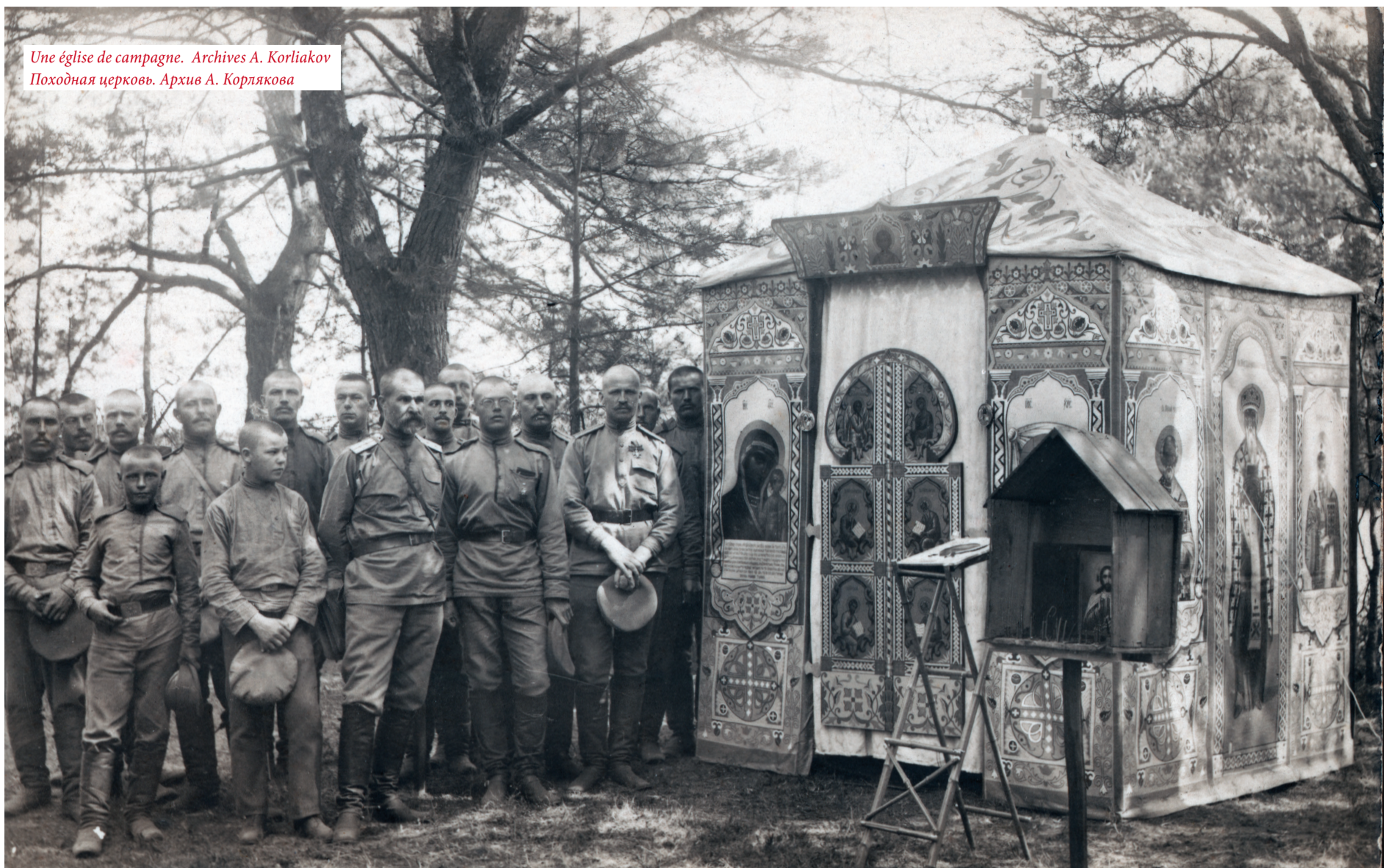
Une église de campagne. Походная церковь.

7 25.12 ДВУНАДЕСЯТЫЙ ПРАЗДНИК FÊTE LITURGIQUE MAJEURE 8 26.12 ВЕЛИКИЙ ПРАЗДНИК GRANDE FÊTE LITURGIQUE 9 27.12 Церковный Праздник святой Fête Liturgique saint 10 28.12 Воскресные и французские нерабочие дни Dimanches et fêtes françaises chômées ☾ Строгий пост Jeûne et abstinence sévères ☾ Поста нет Sans abstinence ni jeûne ☾ Поста Jeûne et abstinence ☾ См. комментарий ко дню Cf. note concernant ce jour