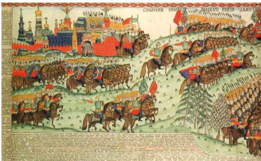
'Bataille de Koulikovo' Loubok 19è s. fragment Куликовская битва Лубок 19 Век. фрагмент

prêtres des régiments et les moines sur les vaisseaux de guerre sont sous leur tutelle. En temps de paix, le clergé des troupes terrestres et de la marine est sous double tutelle – celle du Saint Synode et du commandement militaire. Pour les questions ecclésiastiques, ils sont soumis à l'évêque du diocèse où stationne le régiment et où est enregistré l'équipage du vaisseau. Sous Pierre 1er on voit apparaître dans l'armée et dans la marine des représentants d'autres nationalités, en particulier des allemands et des hollandais, qui sont en principe catholiques ou protestants. Les relations entre les différentes confessions sont règlementées de manière législative, la religion d'état étant l'orthodoxie.