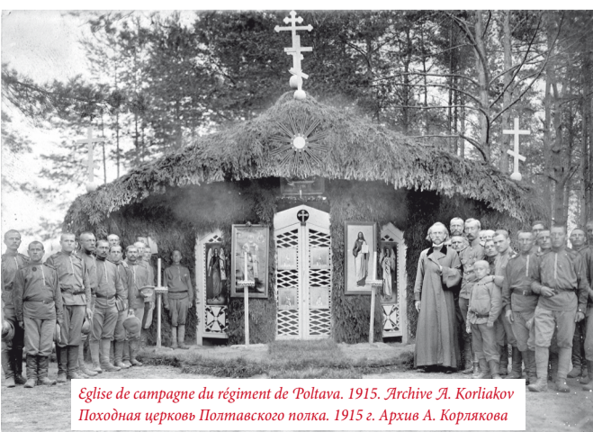
Église de campagne du régiment de Pultava. 1915. Archive A. Korlyakov. Походная церковь Полтавского полка. 1915 г. Архив А. Корлякова

The proto-presbytre G. I. Chavelsky reçut le droit d'assister aux conseils de guerre, qui se tenaient au Grand quartier général du Commandant en chef des armées, ainsi que la possibilité de référer personnellement à l'Empereur.