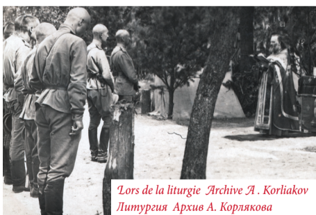
«Lors de la liturgie» Литургия

de la quatrième, le rabbin juif – en face de la cinquième. En face de la sixième table il n'y a que deux grenadiers. La prestation de serment se déroule. Le colonel s'avance vers la sixième table, et je vois que les deux recrues sortent de leurs poches des petits rouleaux d'où ils sortent deux petites idoles en bois, qui sont installées sur la table entre le colonel et les recrues. Alors seulement ce dernier, en tant que chef suprême aux yeux de ces deux hommes, fait prêter serment aux deux grenadiers de servir le Tsar et la Russie « selon les principes du droit divin et de la loyauté ».