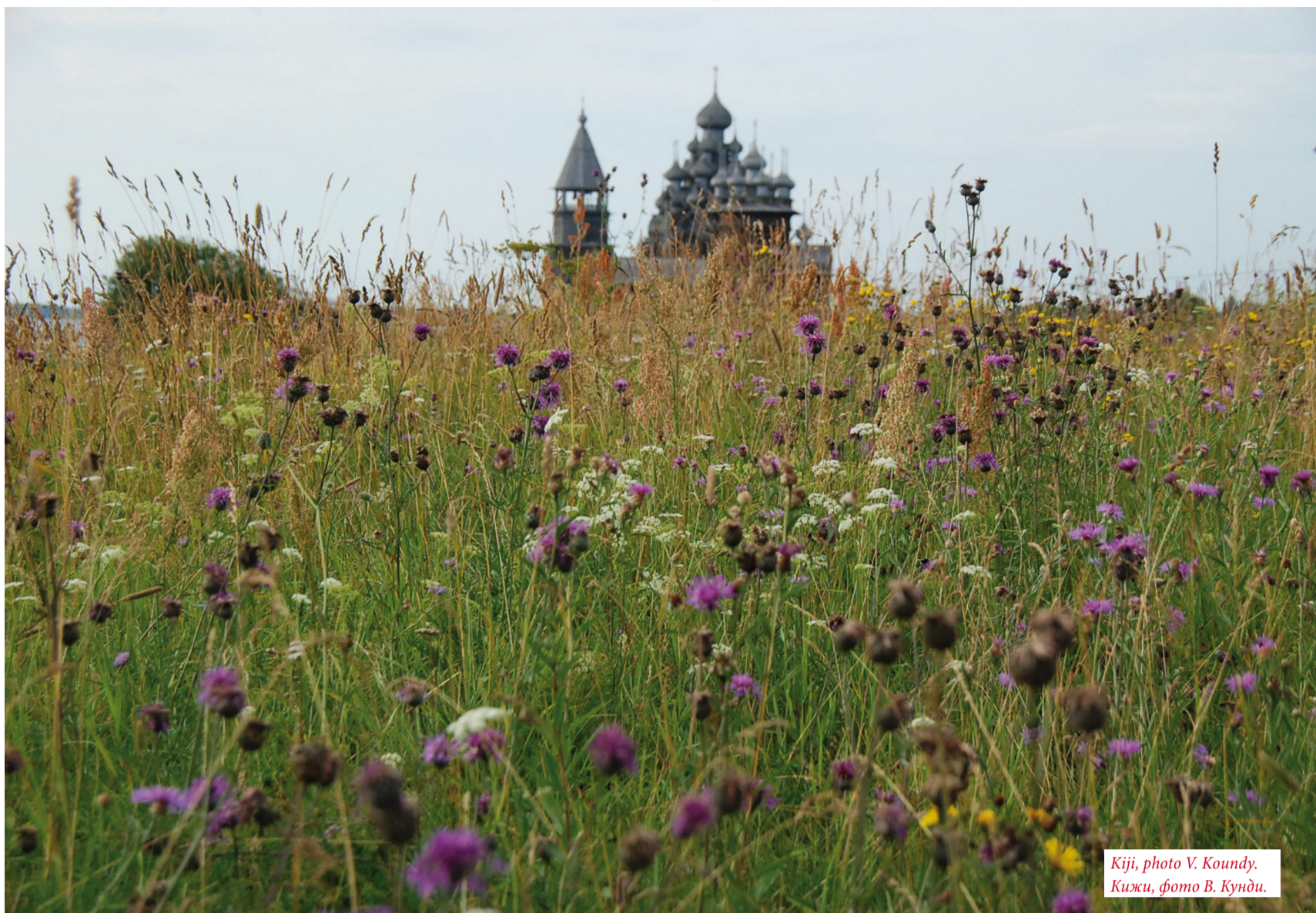
Kiji, photo V. Koundy. Кижы, фото В. Кунди.