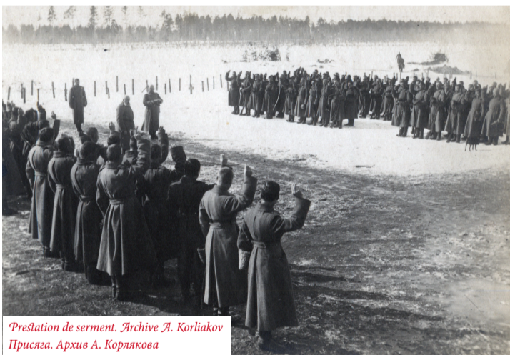
Présentation de serment. Prисяга.

Перед каждым столиком появляются священнослужители разных религий. Полковой священник с Крестом и Евангелием становится перед первым столиком, перед которым стоит самый большой «квадрат» православных новобранцев. Перед вторым столиком становится католический священник, перед третьим — лютеранский пастор, перед четвертым — мусульманский мулла, перед пятым — еврейский раввин, за шестым сто-